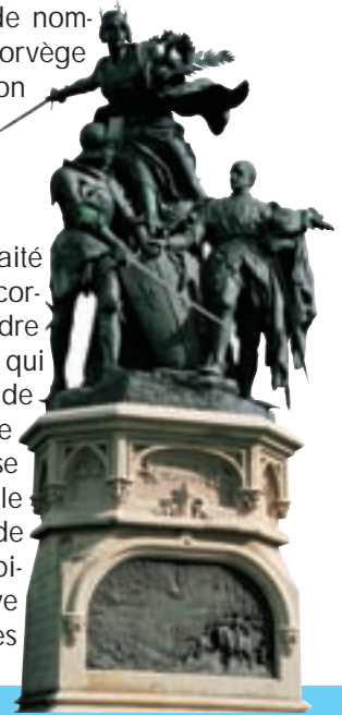
> Bataille de Formigny

L'un de leur chef, Rollon, signe avec Charles le Simple le traité de Saint-Clair-sur-Epte en 911. Il se voit ainsi octroyer ce qui correspondrait aujourd'hui à la Haute-Normandie. Il faut attendre 924 pour que le Bessin devienne également normand. Rollon, qui avait épousé Poppa, fille du comte Béranger, gouverneur de Bayeux, devient alors le 1 er Duc de Normandie. Le plus célèbre d'entre eux, Guillaume le Conquérant , voit le jour à Falaise en 1027 et devient Roi d'Angleterre, après la bataille d'Hastings en 1066. La guerre de Cent Ans est une période tourmentée durant laquelle se succèdent, à partir de 1337, épisodes troubles et intervalles pacifiques. La reconquête définitive est marquée par la bataille de Formigny en 1450 où les