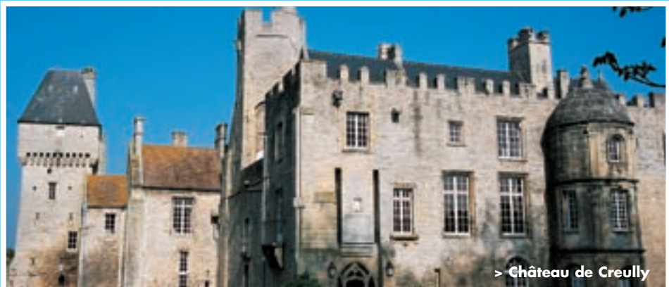
> Château de Creully