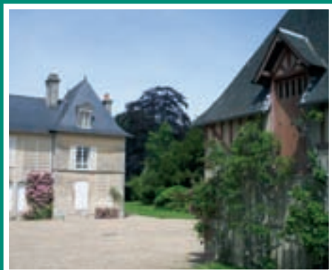
> Manoir de Corainville

Cachées dans le bocage, de belles demeures ponctuent votre promenade.