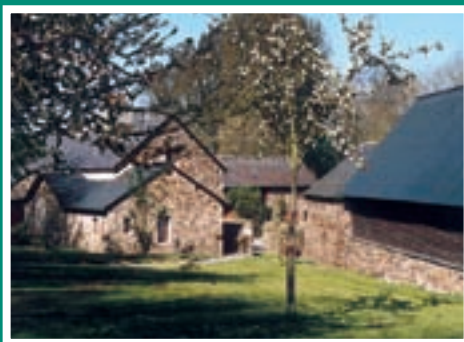
> Moulin de Marcy