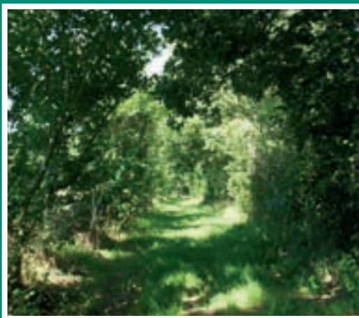
> Chemin Saint-Loup

Terrifiée par un énorme loup qui dévore hommes et bétails, la population demande à Loup, 3 e Evêque de Bayeux de le vaincre. Loup vient au devant du monstre et profite de son étonnement pour lui passer une étole autour du cou. Il le traîne jusqu'à la Drôme et le noie, ce qui lui vaut sa sainteté. Un bas-relief au tympan de la porte du clocher de l'église de Saint-Loup-Hors évoque cette légende.