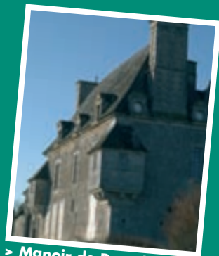
> Manoir de Douville