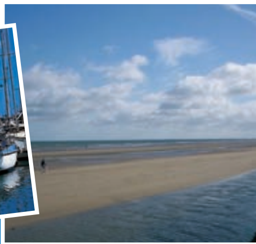
> Plage d'Asnelles