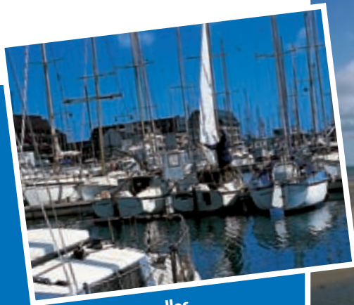
> Port de Courseulles