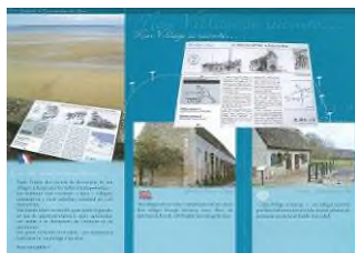
Dépliant de la Mémoire Locale