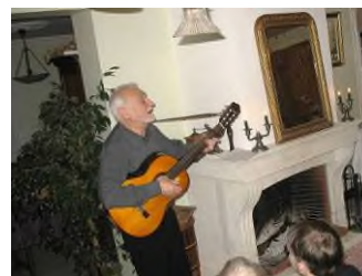
Veillée de Village à Saon – J. Leboutteiller