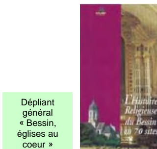
Dépliant général « Bessin, églises au cœur »

Les dépliants édités – dont certains sont épuisés – demandent des mises à jour. Ils concernent plus de 70 églises du Bessin. Leur réédition doit être progressivement réalisée. Des financements seront recherchés afin de pouvoir les traduire en Anglais.