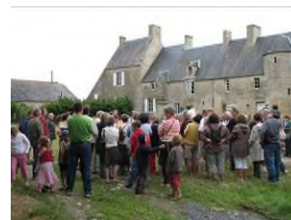
Mon Village se Raconte à Formigny