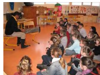
Animation scolaire – Mix Métiss à Isigny sur Mer – Initiation à la musique de Madagascar